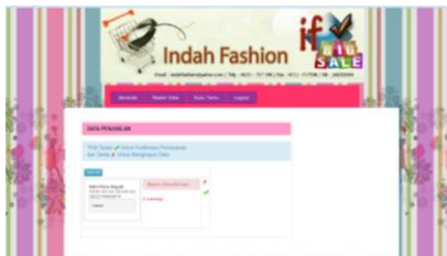
Gambar 8. Tampilan Data Penjualan

Dalam form tampilan data penjualan pada indah fashion