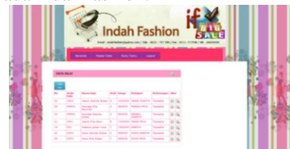
Gambar 3. Tampilan Input Data Baju

Berikut ini gambar tampilan input data baju pada indah fashion.