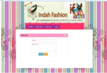
Gambar 5. Tampilan Input Data Kategori

Berikut ini adalah gambar tampilan input kategori pada indah fashion.