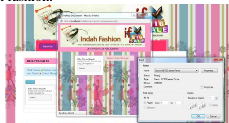
Gambar 12. Tampilan Laporan Data Penjualan

Form pilihan laporan data penjualan pada indah fashion.