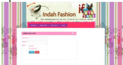
Gambar 6. Tampilan Input Data User

Berikut ini adalah gambar tampilan input data user pada indah fashion.