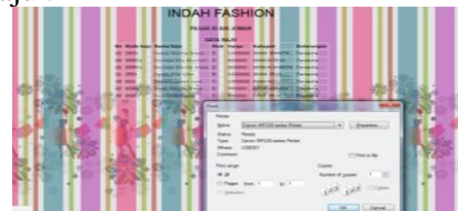
Gambar 11. Tampilan Awal Laporan Data Baju

Form pilihan laporan data baju berfungsi sebagai pendataan pada toko indah fashion. Berikut adalah tampilan form pilihan laporan data baju :