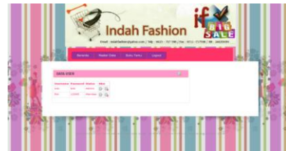
Gambar 10. Tampilan Data User

Tampilan form user pada indah fashion, berikut tampilan gambar pada form jenis kegiatan.