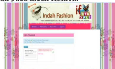
Gambar 4. Tampilan Input Data Penjualan

Berikut ini gambar tampilan data penjualan pada indah fashion.