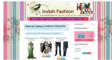
Gambar 1. Tampilan Halaman Utama

melakukan login semua menu akan tampil. Berikut ini adalah gambar tampilan awal form menu utama aplikasi apabila belum melakukan login .