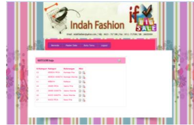
Gambar 9. Tampilan Data Kategori

Form data kategori menampilkan secara detail kategori yang tersedia..