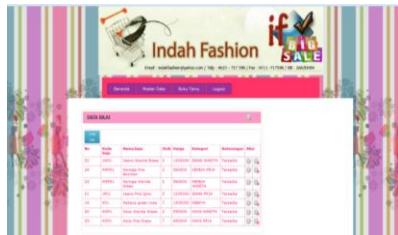
Gambar 7. Tampilan Data Baju

Berikut ini adalah gambar tampilan data baju pada indah fashion.