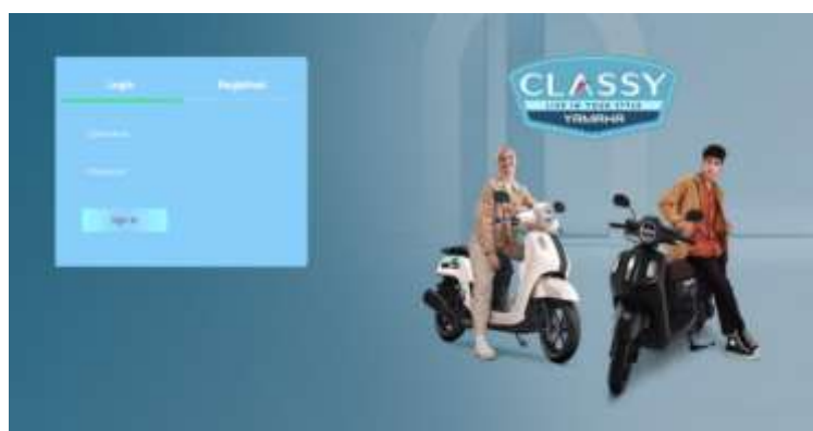
Gambar 2. Tampilan Halaman Login

Halaman login merupakan halaman yang digunakan untuk mendapatkan hak akses pada admin dan user.