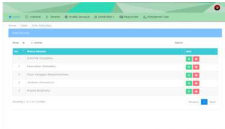
Gambar 6. Tampilan Halaman Dimensi

Tampilan halaman dimensi merupakan halaman yang berisikan data – data dimensi atau parameter untuk mengukur tingkat kepuasan pasien umum pada showroom dunia sakti.