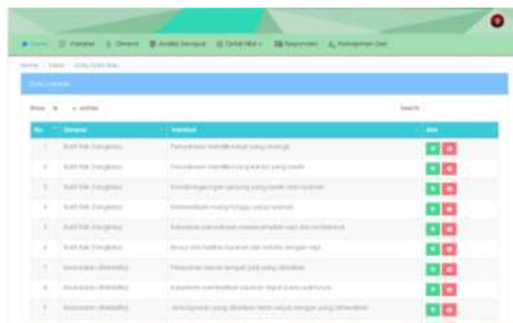
Gambar 5. Tampilan Halaman Pertanyaan

Tampilan halaman pertanyaan merupakan halaman yang berisikan data – data pertanyaan yang akan dijawab oleh pelanggan pada showroom dunia sakti.