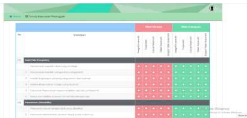
Gambar 13. Tampilan Halaman Kuisisioner