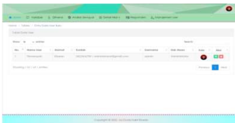
Gambar 12. Tampilan Halaman Manajemen User

Tampilan halaman manajemen user bertujuan untuk menampilkan data admin dan menambah data pengguna baru.