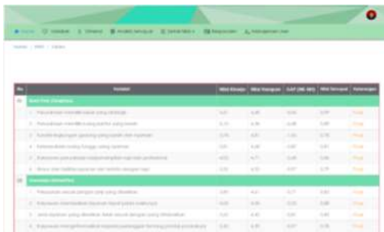
Gambar 7. Tampilan Halaman Analisis

Tampilan halaman analisis merupakan halaman yang menampilkan analisis dari harapan dan kenyataan pelanggan pada pelayanan jasa yang diberikan oleh showroom dunia sakti.