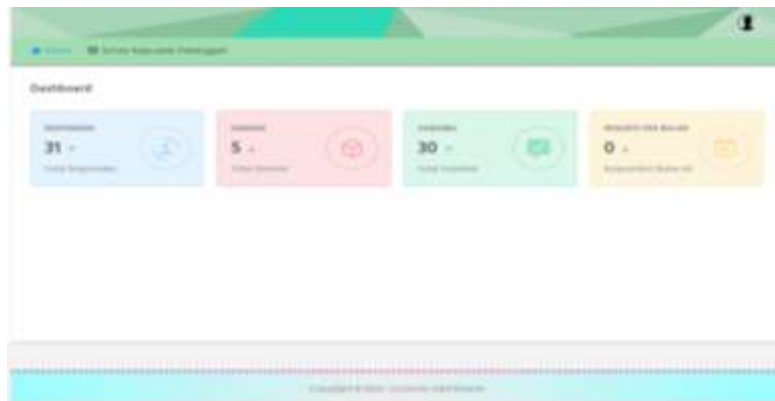
Gambar 4. Tampilan Halaman Utama User

Halaman Menu Utama User ialah halaman yang akan tampil pada awal aplikasi dibuka.