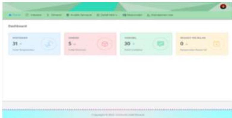
Gambar 3. Tampilan Halaman Utama Admin