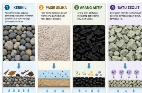
Gambar 2. Media Filtrasi Sistem Pengolahan Air

kepedulian terhadap pengelolaan lingkungan.