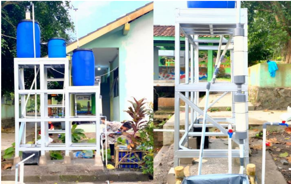
Gambar 3. Pemanfaatan Air Hasil Pengolahan