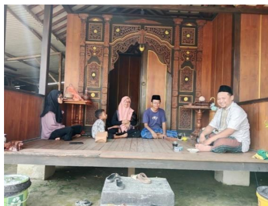
Gambar 1. Survei Lapangan

Tahap pertama dimulai dengan survei lokasi, yang bertujuan untuk mengidentifikasi kesiapan lahan dan fasilitas di lingkungan pesantren yang akan digunakan untuk praktik budidaya alpukat.