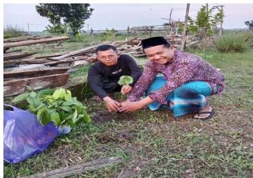
Gambar 2. Penanaman Bibit

Pelatihan inti terdiri atas dua bagian utama, yaitu pelatihan teknis budidaya alpukat dan pelatihan pemasaran digital hasil pertanian. Pemasaran digital merupakan suatu pendekatan yang memanfaatkan teknologi internet dan media digital untuk mempromosikan produk atau layanan (Ririn Fauziyah & Eko Arief Cahyono, 2025). Kegiatan diawali dengan sesi penyuluhan mengenai pentingnya budidaya tanaman alpukat sebagai peluang usaha jangka panjang yang ramah lingkungan. Kemudian dilanjutkan dengan demonstrasi penanaman bibit alpukat yang dipandu langsung oleh instruktur. Peserta dibagi dalam kelompok kecil dan diberikan kesempatan untuk mempraktikkan tahapan penanaman dan perawatan bibit secara langsung.