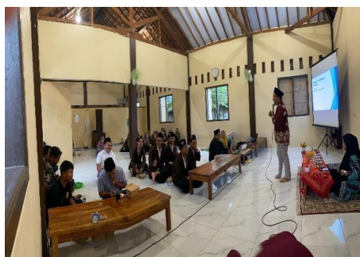
Gambar 3. Presentasi Materi

Setelah itu, peserta juga memperoleh materi digital marketing, yang mencakup cara memasarkan produk hasil pertanian melalui media sosial seperti WhatsApp, Instagram, Facebook, dan TikTok, lengkap dengan teknik membuat konten promosi yang menarik.