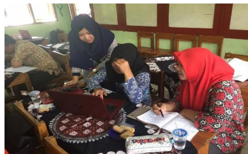
Gambar 4.2 Pelatihan Pembuatan Latar Belakang

Pertemuan ketiga dilaksanakan pada tanggal 14 September 2019, di aula SDN 2 Secang. Tim pelaksana menyampaikan materi mengenai mencari sumber rujukan terkait topik, serta desain pelaksanaan PTK. Materi ini sangat perlu disampaikan karena hampir sebagian besar peserta belum mengetahui cara mencari dan mendapatkan rujukan yang tepat terkait penelitian yang akan mereka lakukan. Pada pertemuan ini, peserta juga dilatih membuat kutipan dan daftar pustaka otomatis. Sehingga, peserta dibiasakan untuk dapat menyusun daftar pustaka secara otomatis tanpa menyusun satu persatu karena sudah tersimpan dan terformat.