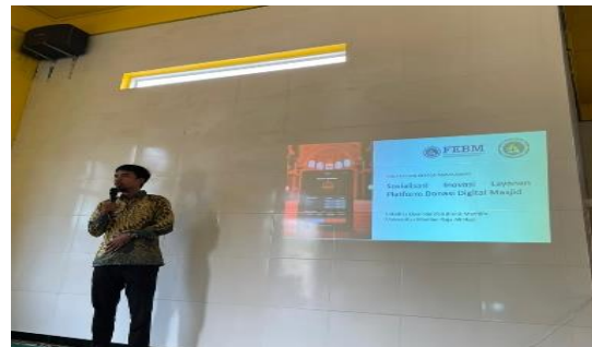
Gambar 3. Pemaparan Materi

Sesi berikutnya diisi dengan pemaparan materi oleh tim pelaksana PKM, yang berfokus pada topik Sosialisasi Manfaat, Keamanan, dan Kemudahan Donasi Cashless Berbasis QRIS. Materi yang dipaparkan secara komprehensif konsep, keunggulan, dan mekanisme implementasi QRIS sebagai sarana donasi digital. Dalam sesi diskusi, pengurus masjid menanyakan aspek teknis terkait pencatatan dan pengelolaan keuangan donasi digital, termasuk bagaimana membedakan transaksi QRIS dari transfer bank biasa, mengingat sistem pencatatan keuangan masjid selama ini masih dilakukan secara manual berdasarkan hasil perhitungan dari kotak amal tunai.