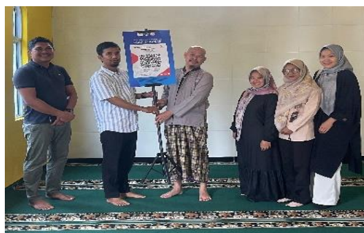
Gambar 4. Penyerahan Standing Banner QRIS

memastikan optimalisasi penggunaan QRIS serta membantu mitra dalam mengatasi kendala teknis yang mungkin muncul. Dengan demikian, kegiatan ini diharapkan dapat menjadi model praktik baik (best practice) dalam pengembangan sistem donasi digital di lingkungan masjid lainnya.