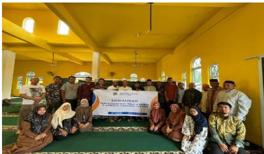
Gambar 2. Foto bersama Mitra

Kegiatan PKM dilaksanakan pada tanggal 23 Juli 2025 yang bertempat di aula Masjid Hidayatul Islamiyah, Kampung Madong, Kota Tanjungpinang. Kegiatan ini dihadiri oleh para pengurus Badan Kemakmuran Masjid (BKM) Hidayatul Islamiyah serta beberapa perwakilan Jemaah masjid.