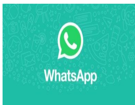
Gambar 3. Simbol Whatsap

Whatsap Messenger atau WhatsApp saja adalah aplikasi pesan untuk smartphone dengan basic mirip BlackBerry Messenger. WhatsApp Messenger merupakan aplikasi pesan lintas platform yang memungkinkan kita bertukar pesan tanpa biaya SMS, karena WhatsApp Messenger menggunakan paket data internet yang sama untuk email, browsing web, dan lain-lain. Aplikasi WhatsApp Messenger menggunakan koneksi 3G , 4G atau WiFi untuk komunikasi data.