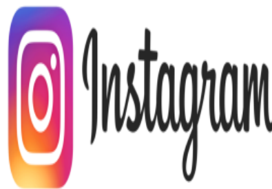
Gambar 2. Simbol Instagram

persegi, sehingga terlihat seperti hasil kamera Kodak Instamatic dan polaroid.