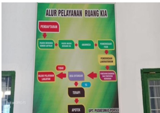
Gambar 5. Alur Pelayanan