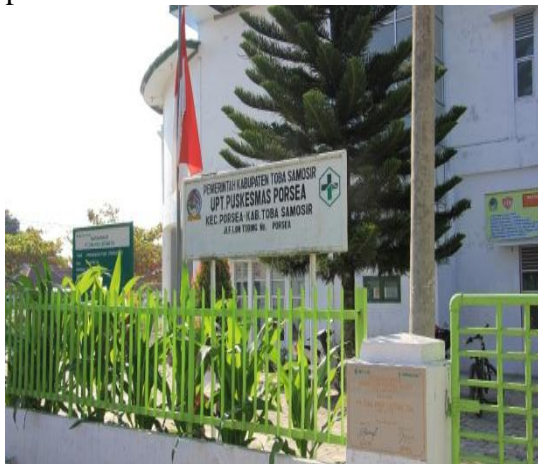
Gambar 4. Gerbang Puskesmas