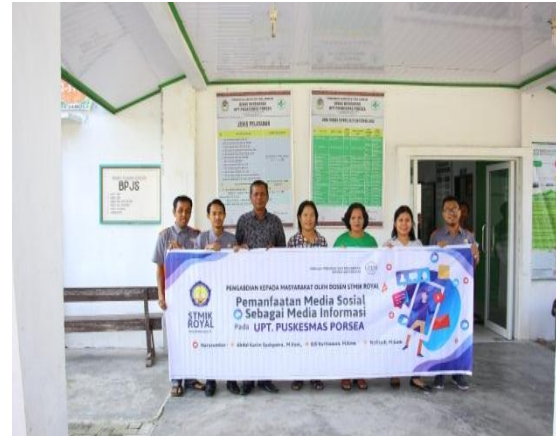
Gambar 6. Foto Bersama dengan Kepala Puskesmas

Berikut beberapa dokumentasi kegiatan pengabdian kepada masyarakat di puskesmas Porsea :