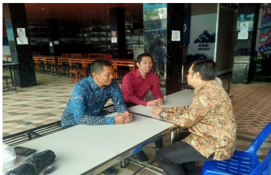
Gambar 2. Forum Group Discussion (FGD)

untuk mendapatkan informasi terhadap jadwal pelaksanaan Pengabdian kepada Masyarakat serta implementasi system website yang nantinya akan dirancang dalam penerapan website UMKM khususnya Warung wawa.