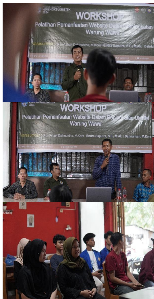
Gambar 3. Kegiatan Workshop Pelatihan Penerapan Websit

form digital website warung wawa. Mitra sangat berterimakasih dan harapannya TIM dosen dapat kembali lagi melaksanakan kegiatan serupa dengan teknologi digital lainnya dalam mengembangkan usaha UMKM Warung wawa dan UMKM lainnya khususnya kota kisan.