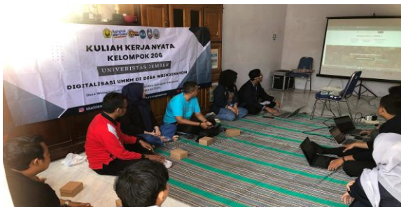
Gambar 4. Pelatihan admin website di balai desa

Pelatihan Admin Website pelatihan penggunaan WordPress dilakukan di kantor Wringinanom dengan melatih perangkat desa sebagai administrator website desa supaya dapat menginput data UMKM terbaru untuk kedepannya.