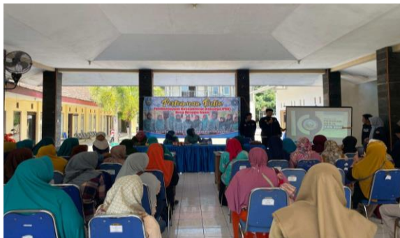
Gambar 1. Kegiatan pengenalan dengan tim pelaksana

Pengumpulan Data UMKM data yang digunakan merupakan data primer, yaitu dengan mengunjungi langsung lokasi UMKM yang ada pada setiap dusun di Desa Wringinanom dengan bantuan ketua RT dan melakukan wawancara langsung dengan pelaku UMKM (Prihamdani et al. , 2023). Data yang dibutuhkan adalah jenis usaha, nama pemilik, lokasi, deskripsi produk/usaha, harga produk, dan omzet/tahun. Data tersebut dapat dijadikan sebagai acuan dalam memilih jenis UMKM yang berpotensi. Selain itu juga dapat ditampilkan pada website dengan tujuan sebagai bahan informasi produk UMKM pada website .