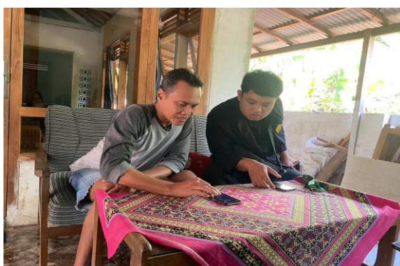
Gambar 2. Pendataan UMKM di salah satu RT

Pengumpulan Data UMKM data yang digunakan merupakan data primer, yaitu dengan mengunjungi langsung lokasi UMKM yang ada pada setiap dusun di Desa Wringinanom dengan bantuan ketua RT dan melakukan wawancara langsung dengan pelaku UMKM (Prihamdani et al. , 2023). Data yang dibutuhkan adalah jenis usaha, nama pemilik, lokasi, deskripsi produk/usaha, harga produk, dan omzet/tahun. Data tersebut dapat dijadikan sebagai acuan dalam memilih jenis UMKM yang berpotensi. Selain itu juga dapat ditampilkan pada website dengan tujuan sebagai bahan informasi produk UMKM pada website .