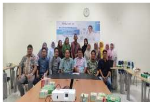
Gambar 2. Foto Bersama Setelah Kegiatan Pelatihan

Berdasarkan penjelasan tersebut, pelatihan pembuatan proposal penelitian dan pengabdian kepada masyarakat bertujuan untuk meningkatkan kemampuan para dosen atau tenaga pengajar di Politeknik Aceh dalam menyusun proposal dengan tepat dan efektif. Setelah terlaksananya kegiatan pelatihan, diharapkan kemampuan mereka dalam membuat proposal penelitian yang meyakinkan akan meningkat, sehingga proposal tersebut dapat segera mendapatkan dukungan untuk pelaksanaannya di lapangan. Ini juga merupakan dukungan dari penyelenggara pelatihan dalam mewujudkan mandat Tri Dharma Perguruan Tinggi.