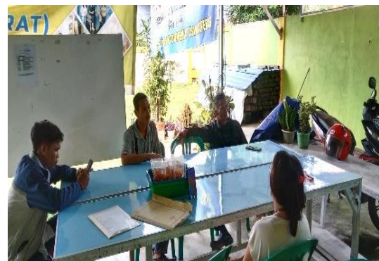
Gambar 2. Kegiatan Sosialisasi Website KOWAPI Cabang Bengkayang.

Dosen Institut Shanti Bhuana mensosialisasikan bahwa pengurus maupun anggota organisasi KOWAPI Cabang Bengkayang sudah dapat mengakses website secara online dan mensosialisasikan apa saja yang tersedia pada website KOWAPI Cabang Bengkayang, terkhusus website menyediakan konten-konten berita dan pengumuman penting lain yang berkaitan dengan organisasi KOWAPI Cabang Bengkayang. Hal tersebut dapat membantu agar pengurus maupun anggota tidak ketinggalan update dari organisasi KOWAPI Cabang Bengkayang.