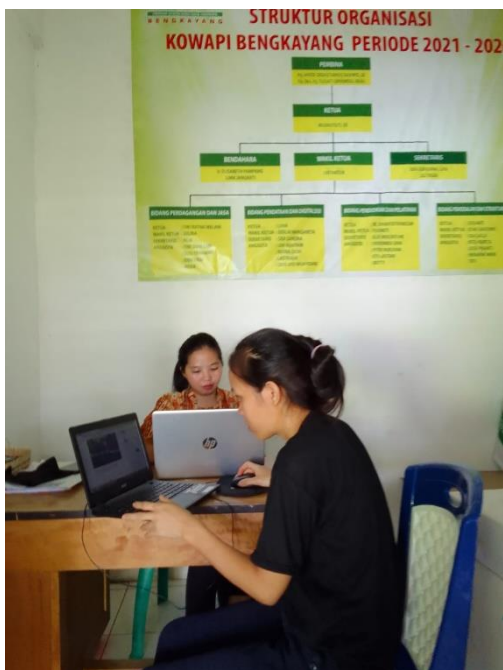
Gambar 3. Pengenalan CMS Wordpress.

fitur yang pastinya akan lebih sering diakses, khususnya dalam pengelolaan konten berita dan dokumentasi kegiatan.