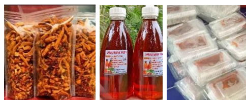
Gambar 1. Produk KUBE Asahan

oleh KUBE Asahan sulitnya mendesain kemasan produk dalam meningkatkan citra produk dimata konsumen. Saat ini desain kemasan produk masih sangat sederhana sehingga kurang menarik yang memberikan dampak turunnya minta beli dikarenakan keraguan konsumen dalam membeli produk yang tidak memiliki desain kemasan produk yang memberikan informasi produk (Widiati, 2020).