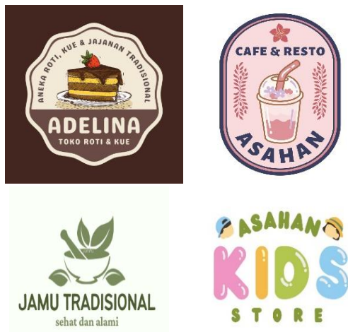
Gambar 5. Hasil desain kemasan produk KUBE Asahan

yang ingin dibuat. Setelah itu, akan ada banyak sekali fitur yang bisa kamu coba seperti halnya tampilan ketika kamu membuat logo. Berikut beberapa hasil desain menggunakan aplikasi Canva yang dikerjakan oleh peserta dari KUBE Asahan.