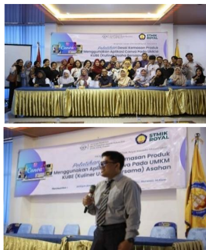
Gambar 2. Kegiatan workshop desain kemasan produk KUBE Asahan

dalam upaya transfer knowledge berupa ceramah pemberian materi secara langsung oleh narasumber kepada peserta workshop KUBE Asahan. Narasumber berperan penting dalam menjelaskan materi-materi serta mempraktekkan aplikasi desain yaitu Canva seperti yang terlihat pada gambar 2 dibawah ini.