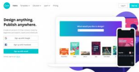
Gambar 3. Login akun Canva