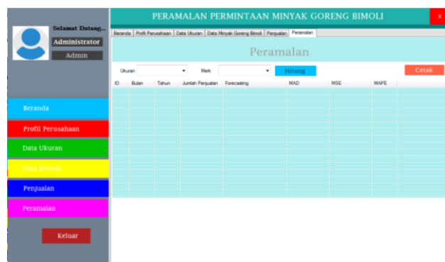
Gambar 2. Halaman Peramalan sistem forecasting

Setiap menu yang ada mempunyai fungsi masing-masing untuk melakukan pengolahan data yang menghasilkan informasi. Berikut ini adalah gambar tampilan halaman utama administrator sistem forecasting permintaan minyak goreng bimoli dengan metode Single Moving Average (SMA) di PT. Alam Jaya Wirasantosa: