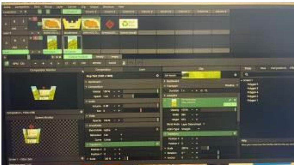
Gambar 2. Pengaturan di Aplikasi Resolume Arena

dengan memanfaatkan efek morphing serta iringan suara ambient untuk menjaga kesinambungan suasana dan memperkuat kohesi naratif secara keseluruhan