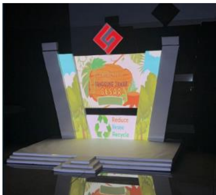
Gambar 4. Hasil di Aplikasi Resolume Arena dan Mapping di Panggung

Gambar 3 menunjukkan proses pengaturan video mapping pada miniatur panggung untuk mengevaluasi akurasi pemetaan visual, kualitas proyeksi, dan kesesuaian tampilan konten sebelum implementasi pada panggung sebenarnya.