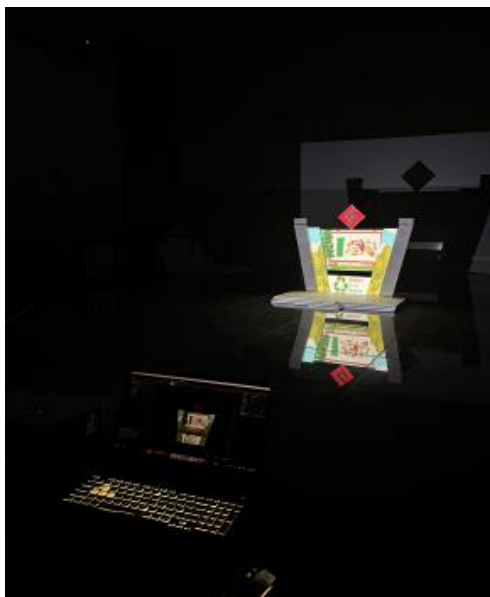
Gambar 3. Pengaturan di Aplikasi Resolume Arena dan Mapping di Panggung

Gambar 3 menunjukkan proses pengaturan video mapping pada miniatur panggung untuk mengevaluasi akurasi pemetaan visual, kualitas proyeksi, dan kesesuaian tampilan konten sebelum implementasi pada panggung sebenarnya.