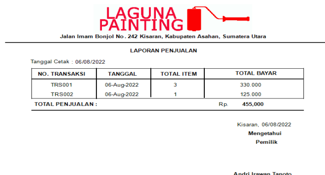
Gambar 8. Implementasi Laporan Penjualan Barang

Laporan ini digunakan oleh pemilik untuk melihat daftar barang apa saja yang terjual dan juga dapat melihat total penjualan.