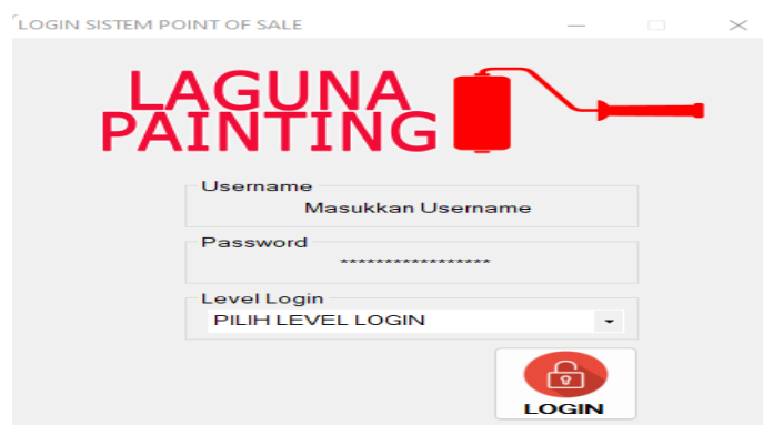
Gambar 1. Implementasi Halaman Login

Pada tampilan Form login terdapat username dan password. Jika ingin masuk ke sistem, Admin dan Pemilik wajib menginputkan username dan password yang benar.