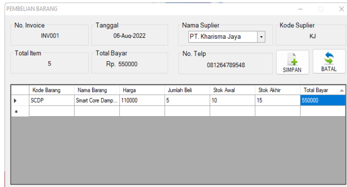
Gambar 6. Implementasi Input Transaksi Pembelian Barang

Halaman ini digunakan oleh admin untuk menginputkan data pembelian barang dari supplier.