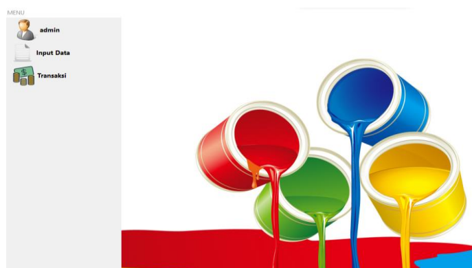
Gambar 2. Implementasi Halaman Admin

Halaman utama admin merupakan tampilan yang akan terlihat setelah Admin berhasil melakukan login :