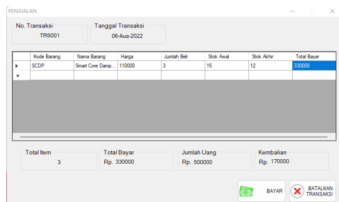
Gambar 7. Implementasi Input Transaksi Penjualan Barang

Halaman ini digunakan oleh admin untuk proses transaksi data penjualan barang ke pelanggan.