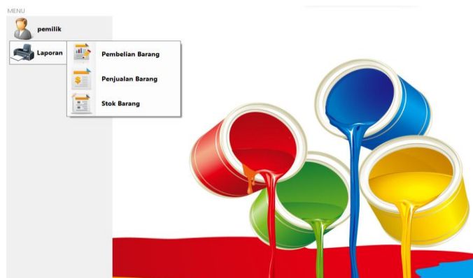
Gambar 3. Implementasi Halaman Admin

Halaman utama pemilik merupakan tampilan yang akan terlihat setelah Pemilik berhasil melakukan login :