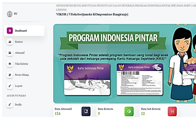
Gambar 1. Tampilan Menu Utama Admin

Admin melakukan login terlebih dahulu ke dalam sistem, setelah berhasil login maka akan tampil menu utama admin sistem pendukung keputusan penentuan calon penerima Program Indonesia Pintar (PIP) pada SMPN 2 Aek Ledong. Menu utama admin memiliki dashboard , kriteria, alternatif, nilai kriteria, proses hitung, logout , dan profil. Berikut ini tampilan menu utama admin :