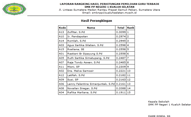
Gambar 6. Implementasi Laporan Perangkingan

Tampilan laporan perangkingan merupakan output dari hasil perhitungan yang dilakukan oleh Admin. Laporan ini menampilkan urutan nilai calon alternatif berdasarkan perolehan nilainya dari yang tertinggi sampai dengan yang terendah.